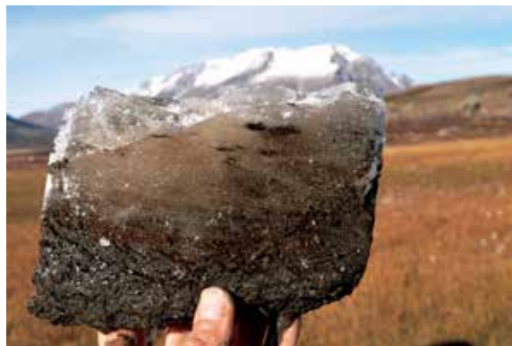
Fig. 1. Den øverste isholdige permafrost er fritlagt og sammensætningen af sediment, vand og luftbobler ses tydeligt. Den sidste komponent, mikroorganismene, er ikke synlig, men helt afgørende for at forstå hvilken betydning det har, at permafrost tør (se artiklen "Den levende permafrost").