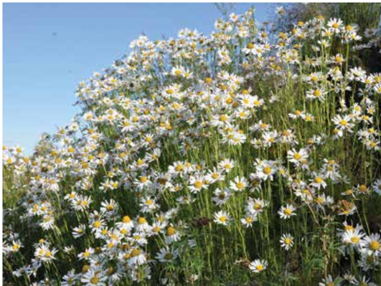
Fig. 4. Frodig vegetation ses, hvor smeltevand fra permafrostoptøning bliver tilgængeligt for planter.

Den slags begivenheder er velkendte, men det er et åbent spørgsmål, om sådanne begivenheder optræder hyppigere eller i større omfang i dag, som et resultat af de seneste klimaændringer i Grønland.