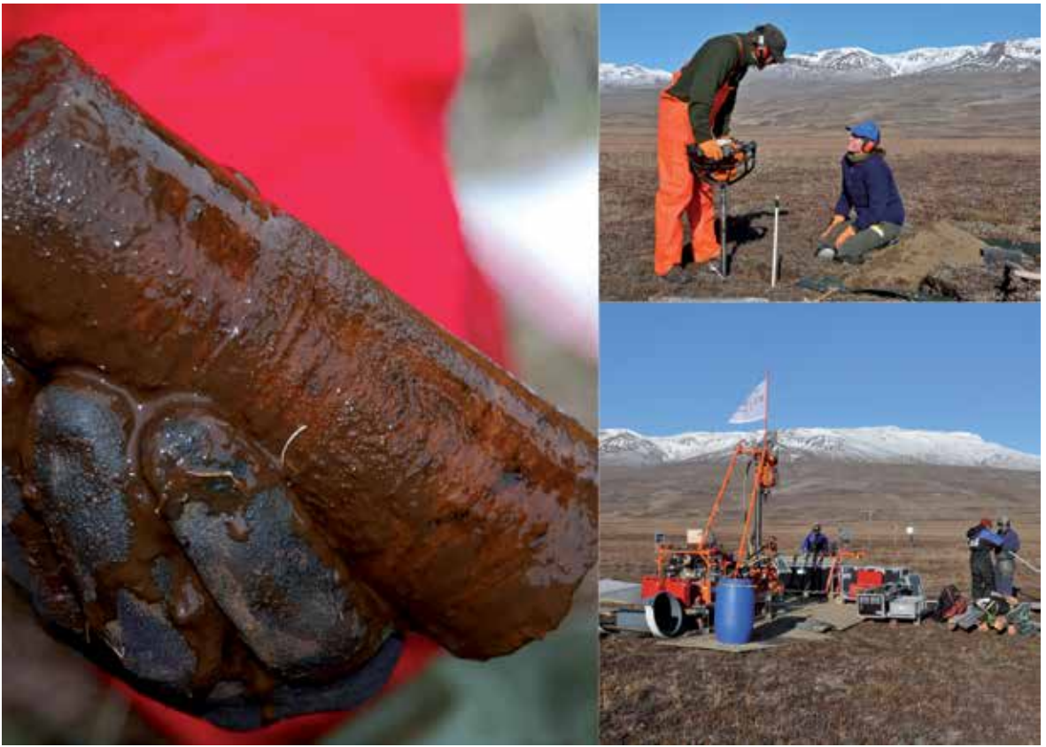
Fig. 2. Permafrostboringer. Den store borerig blev anvendt i Zackenberg i Nordøstgrønland i 2012. Den håndholdte borerig bruges på alle CENPERM sites og er velegnet til at tage kerneprøver i de øverste 3-4 meter.